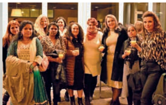
Weihnachtsfeier am 18. November