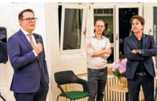
Eröffnungsanlass Zentrum für Schmerz- und Stressmedizin (ZSSM), Bern, am 27. Oktober