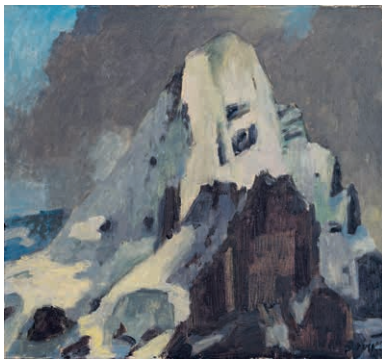
Arnold Brügger, 1888–1975 «Der Berg» Öl auf Leinwand, 46 x 50 cm